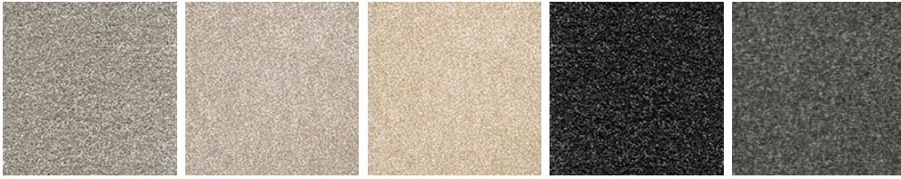
TUFTEX TWIST 07 TUFTEX TWIST 45 TUFTEX TWIST 53 TUFTEX TWIST 59 TUFTEX TWIST 96