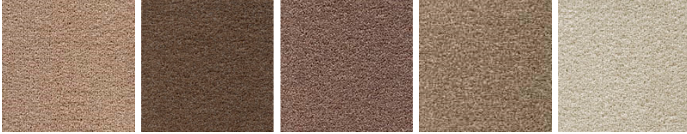
TUFTEX TWIST 30 TUFTEX TWIST 39 TUFTEX TWIST 34 TUFTEX TWIST 32 TUFTEX TWIST 92