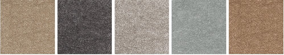
MEMORIES 36 MEMORIES 43 MEMORIES 45 MEMORIES 75 MEMORIES 84